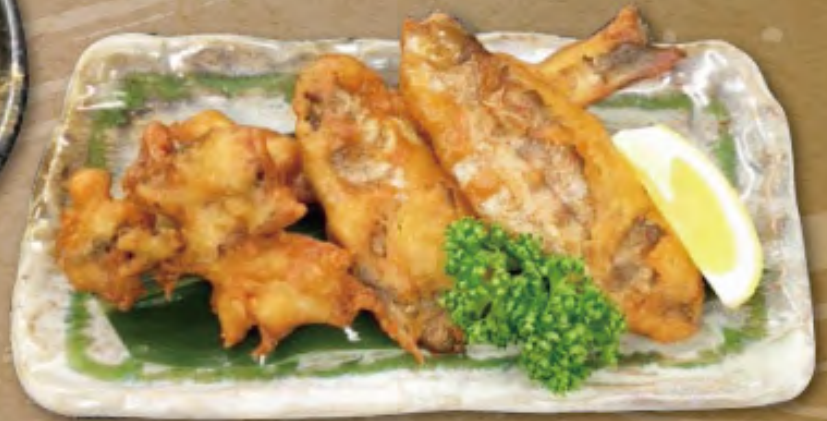
あめごの唐揚げ……700円