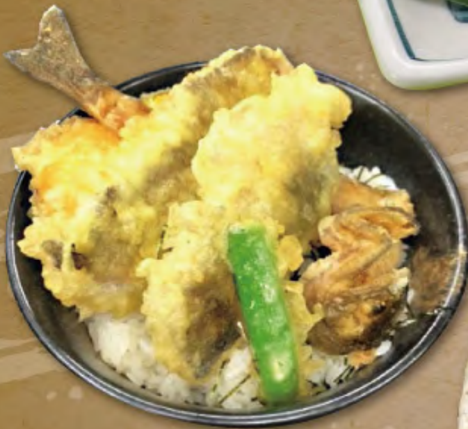
あめご天丼(香物・マタギ汁付) ……950円