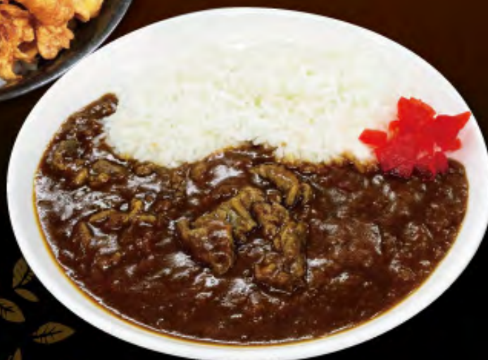
鹿肉コロッケ(2個) 650円