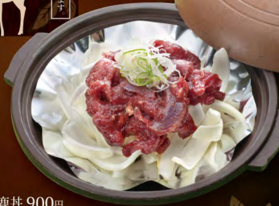
鹿丼 900円 香物・マタギ汁つき