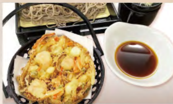
かきあげざる蕎麦 850円